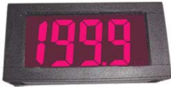
DPM-740X 系列 (LCD)背光