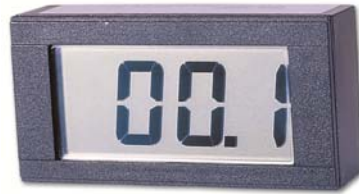
DPM-740X 系列 (LCD)